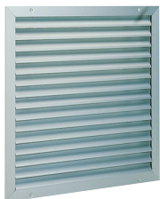
Grille AWA 251